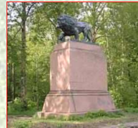
Памятник над могилой К.И.Бистрома. Скульптор П.К.Клодт (г.Кингисепп)

Федоров Б. Символ доблести и отваги: [160 лет со дня смерти К.И.Бистрома] // Время. - 1998. - 1 июля; Вост.берег. - 1998. - №26. - С.7.