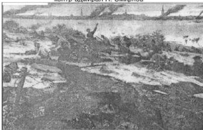
Героическая оборона Таллинна в 1941 г. Фрагмент диорамы в музее ДКБФ