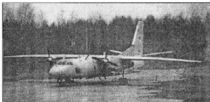
Военно-транспортный самолет ВВС БФ