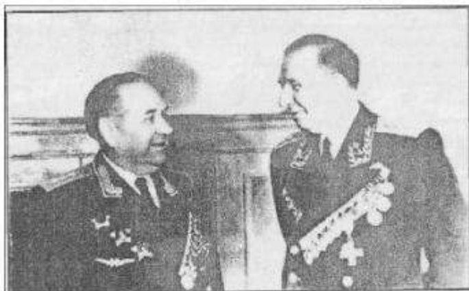
Адмирал В. Ф. Трибуц и генерал-полковник М. И. Самохин