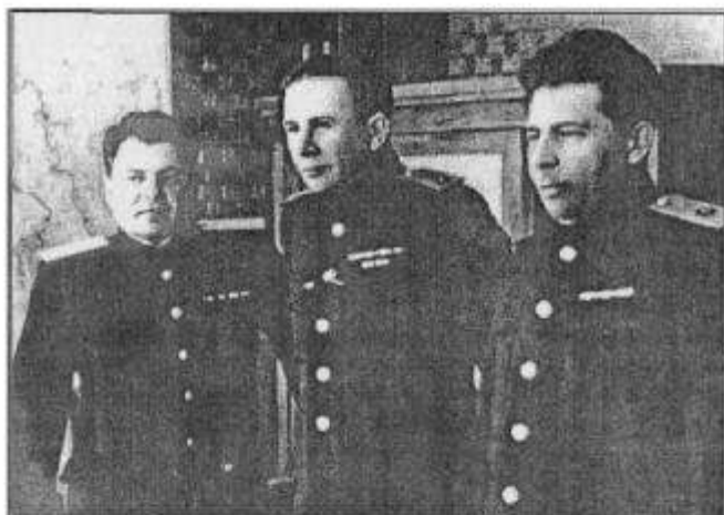
Военный Совет Балтийского флота (слева направо): генерал-майор А. Вербицкий, адмирал В. Трибуц, контр-адмирал Н. Смирнов